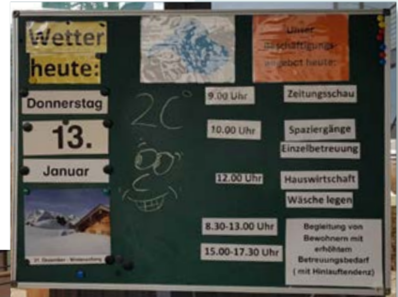
vor dem CareDay

Einrichtungsleitung Städtisches Pflegeheim am Lutzepark